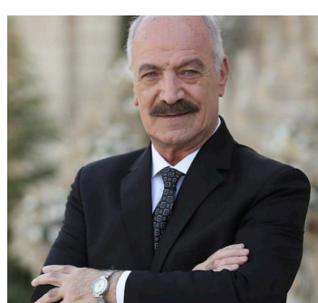
درگذشت سعید راد بازیگر مطرح سینمای ایران صفحه ۴