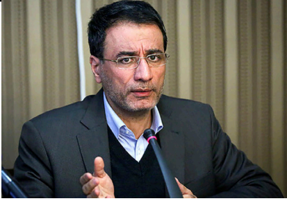
عبدالرضا فرجی راد: پزشکيان زنگ هشدارهای سیاست خارجی را شنیده‌اند!

شفیعیان در پاسخ به این سوال که در برخی وزارتخانه‌های مهم که ملاحظات زیادی از سوی برخی نهادها وجود دارد به چه صورت فرآیند انتخاب انجام می‌شود، گفت: در وزارتخانه‌هایی که ملاحظات دیگر نهادها نیاز است، حتماً آن ملاحظات رعایت خواهد شد و در کارگروه‌ها هم افراد کارشناسی هستند که به همراه شخص رئیس‌جمهور این ملاحظات را در نظر می‌گیرند.