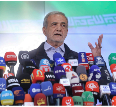
دکتر پزشکیان در نشست با نمایندگان ادوار و دوره دوازدهم مجلس شورای اسلامی:

مشکل ما قبل از آنکه دشمنی با آمریکا باشد مربوط به عملکرد خودمان است