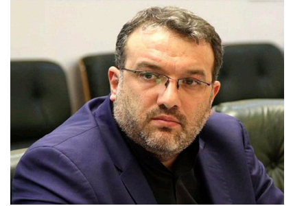
هشدار مهم فرید موسوی به پزشکيان درباره چنين كابينه